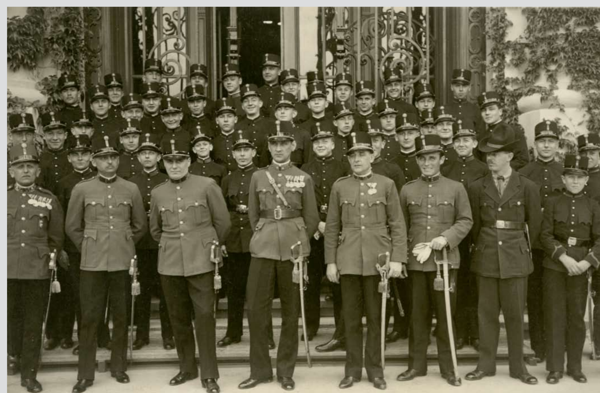
A m. kir. „Zrínyi Miklós” reáliskolai nevelőintézet VI. évfolyamos növendékei tisztjeikkel. Pécs, 1937. június Sixth-year students of the Royal Hungarian “Miklós Zrínyi” Boarding School with their officers. Pécs, June 1937