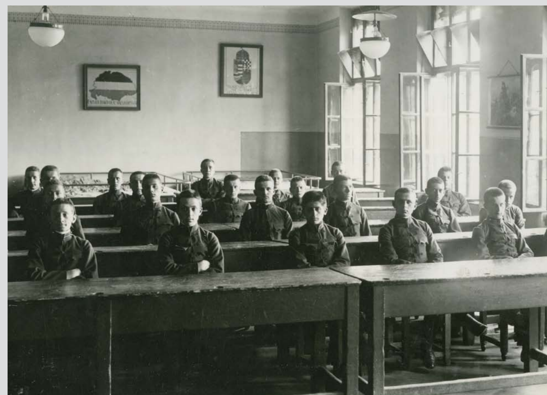
A m. kir. „Bocskai István” reáliskolai nevelőintézet tanterme. Budapest, Hűvösvölgyi út, 1922-1931 Classroom of the Royal Hungarian “István Bocskai” Boarding School. Budapest, 1922-1931