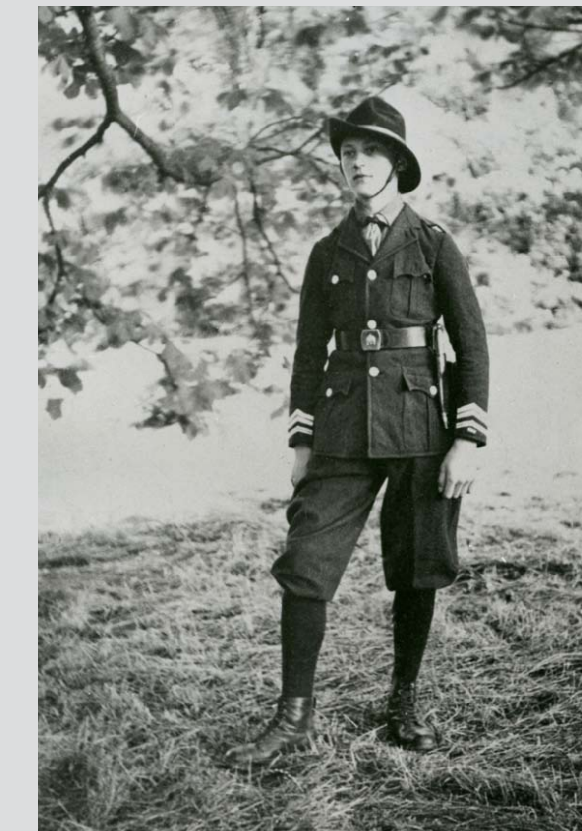
Reáliskolai nevelőintézeti növendék „gyakorló sportöltözete” a rejtés időszakából, valójában módosított cserkész-egyenruha, 1932-1938 Boarding school student's sports gear from the army's concealed period, in fact a modified Boy Scout uniform, 1932-1938