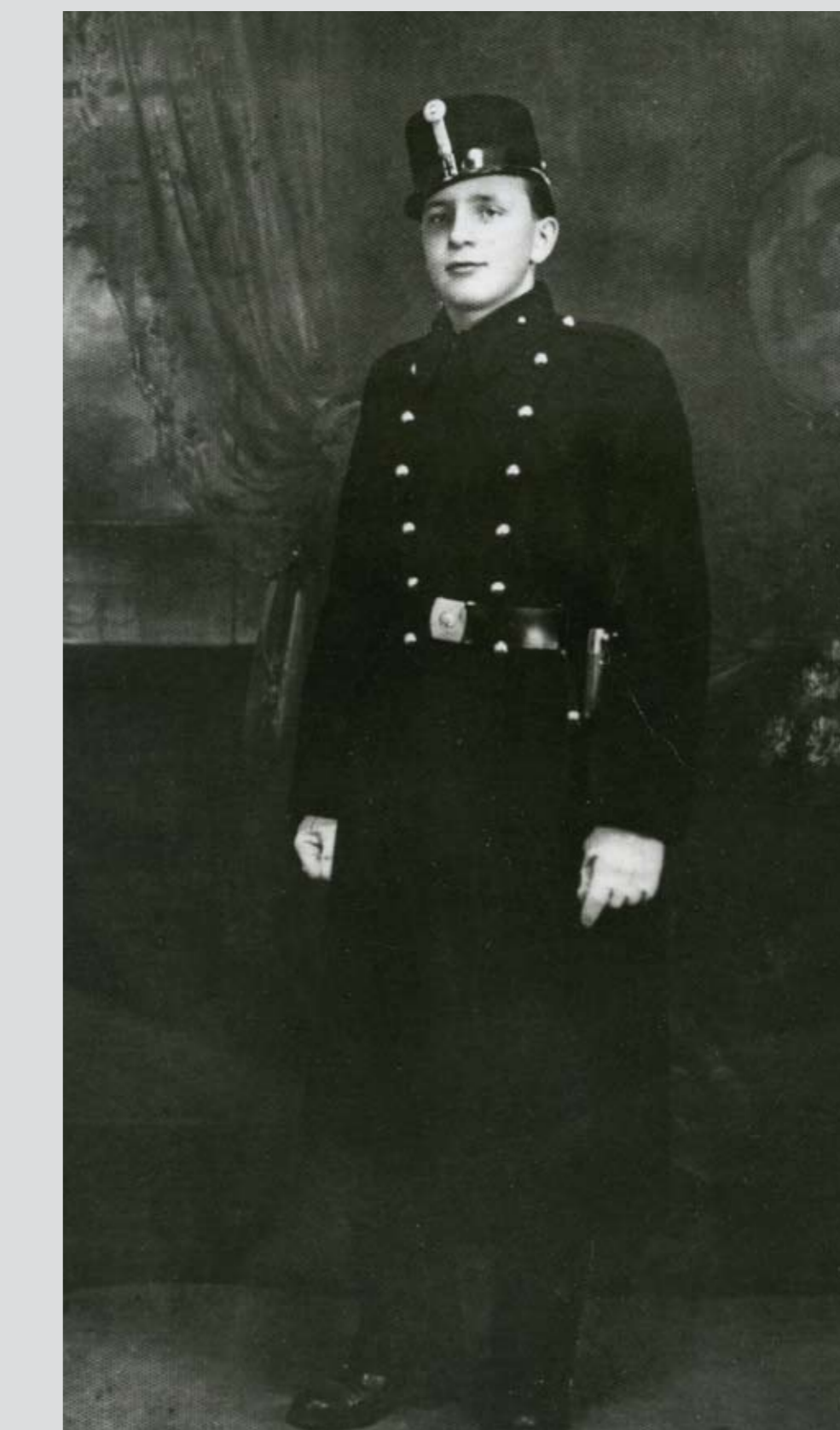
Főreáliskolai növendék, 1938-1944 Boarding school student, 1938-1944