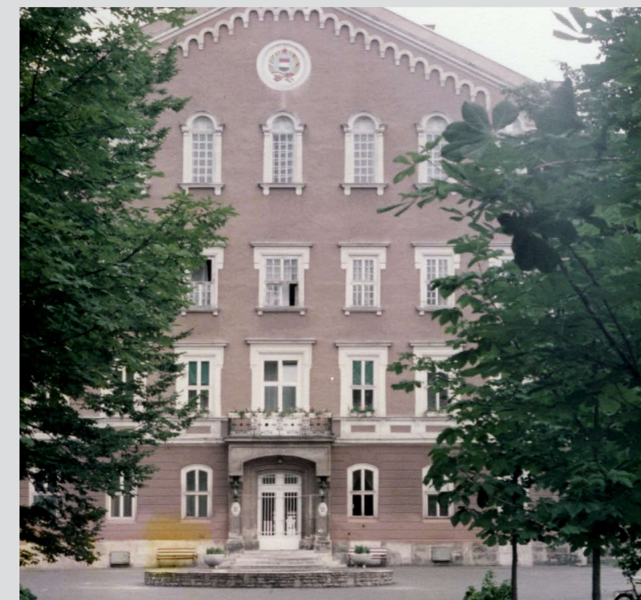
M. kir. „Hunyadi Mátyás” reáliskolai nevelőintézet főépületének homlokzata. Kőszeg, 1930-as évek eleje Facade of the Royal Hungarian “Mátyás Hunyadi” Boarding School's main building. Kőszeg, early 1930s