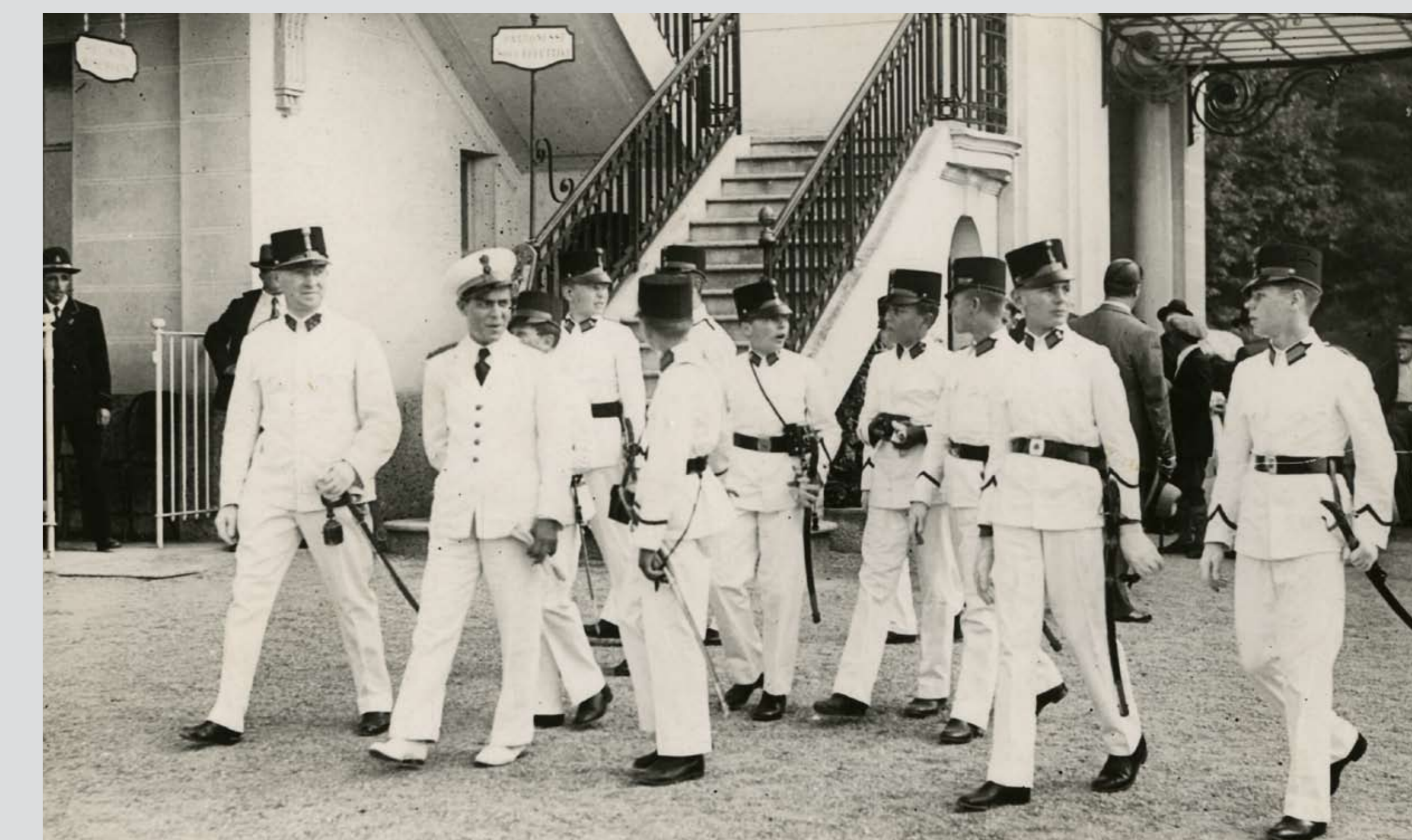
A m. kir. „Zrínyi Miklós” reáliskolai nevelőintézet növendékei olaszországi látogatáson. Nápoly, 1936 Students of the Royal Hungarian “Miklós Zrínyi” Boarding School at a visit to Italy. Naples, 1936

The Royal Hungarian “István Bocskai” Boarding School's parade squad marching to a parade in Vértmező (District I, Budapest) commemorating the Regent's 60th birthday. Budapest, 18 June 1928