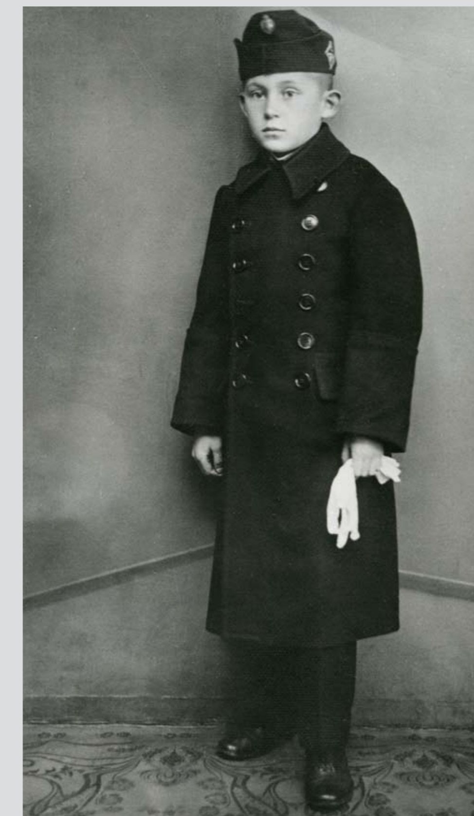
Reáliskolai nevelőintézeti növendék téli kimenő öltözetben, 1924 Boarding school student in winter walking-out uniform, 1924