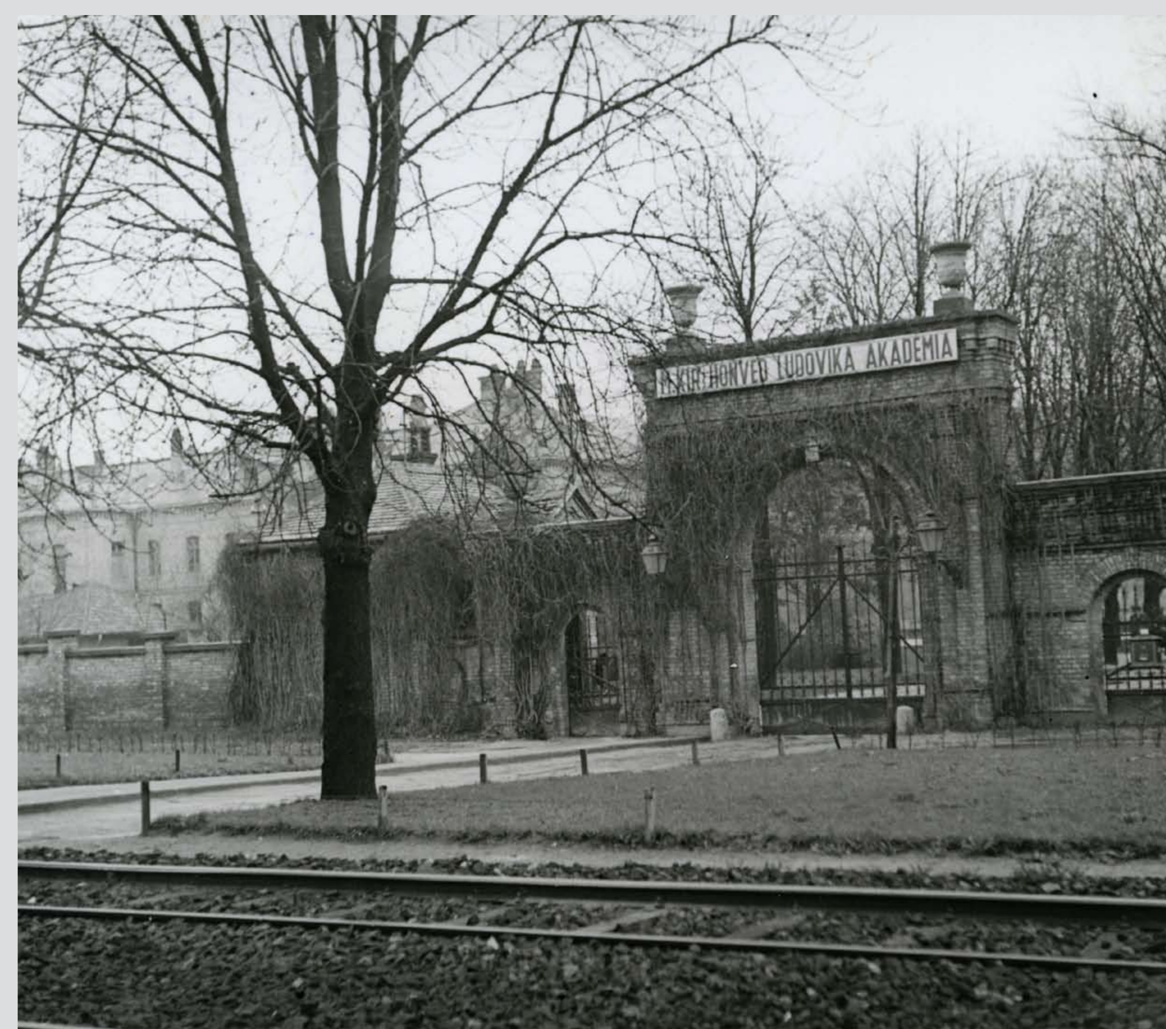
Ludovika Akadémia II. főcsoport, Budapest, Hűvösvölgyi út, 1931-1939 II Division of the Ludovika Academy, Budapest, 1931-1939