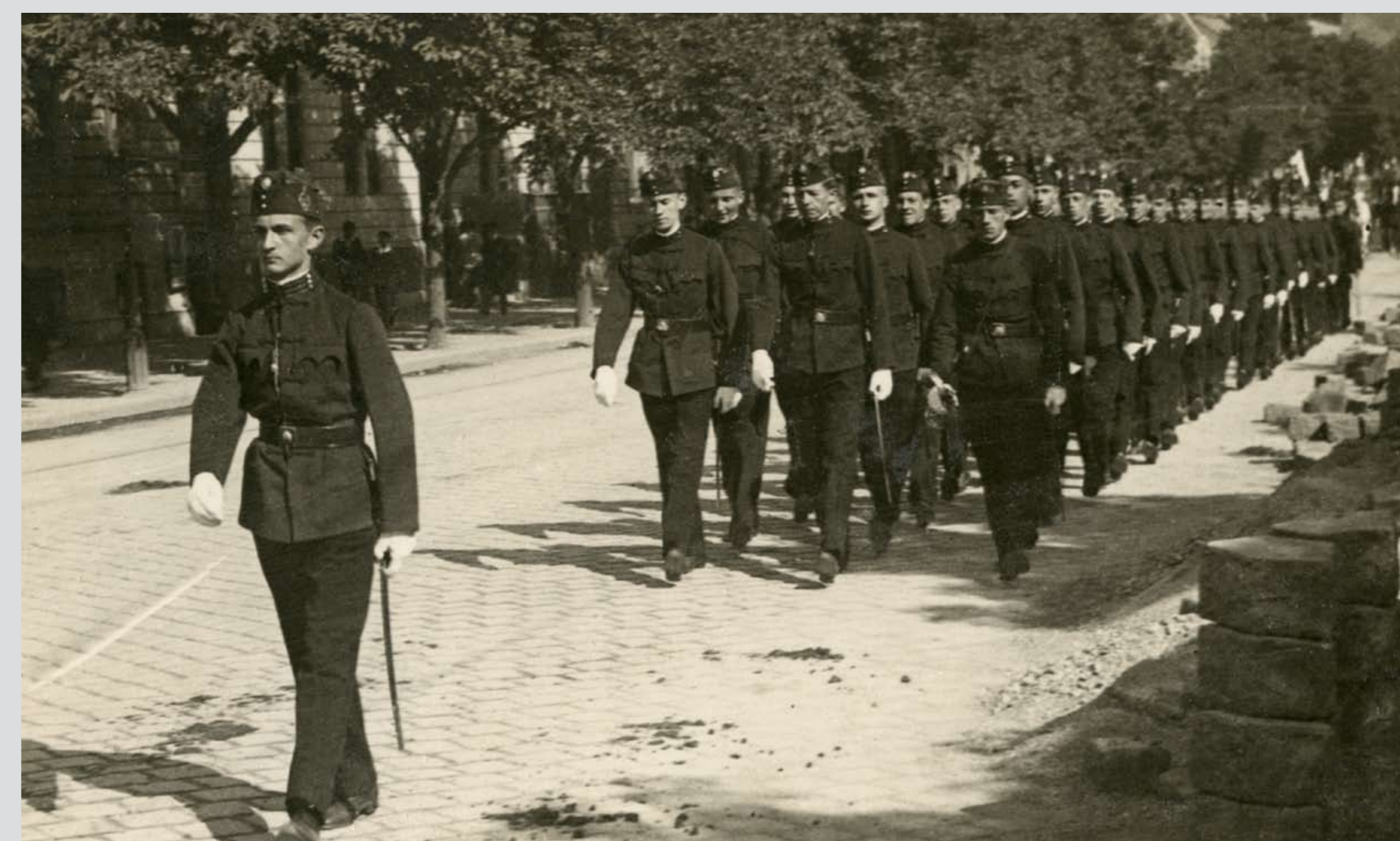
A m. kir. „Bocskai István” reáliskolai nevelőintézet növendék díszszakasza menetben a kormányzó 60. születésnapja alkalmából a Vértmezőn megrendezendő díszszemlére. Budapest, 1928. június 18.

The Royal Hungarian “István Bocskai” Boarding School's parade squad marching to a parade in Vértmező (District I, Budapest) commemorating the Regent's 60th birthday. Budapest, 18 June 1928