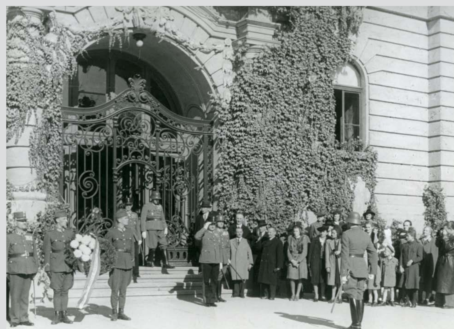
Évfolyamtalálkozó a m. kir. „Zrínyi Miklós” honvéd gyalogsági hadapródiskolán. Pécs, 1943. október 31. Class reunion at the Royal Hungarian “Miklós Zrínyi” Infantry Cadet School. Pécs, 31 October 1943