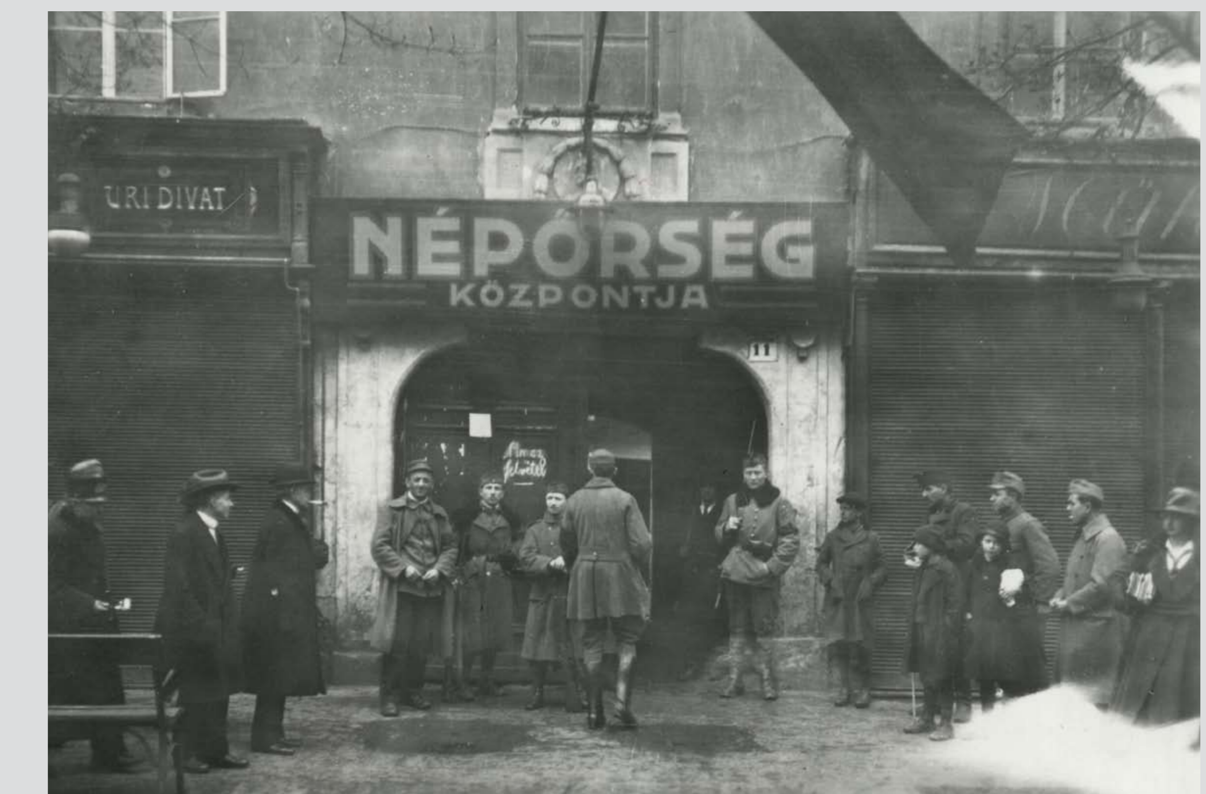
A Néppőrség központjának bejárata. Budapest, 1918–1919 Entrance of the People's Guard headquarters. Budapest, 1918–1919