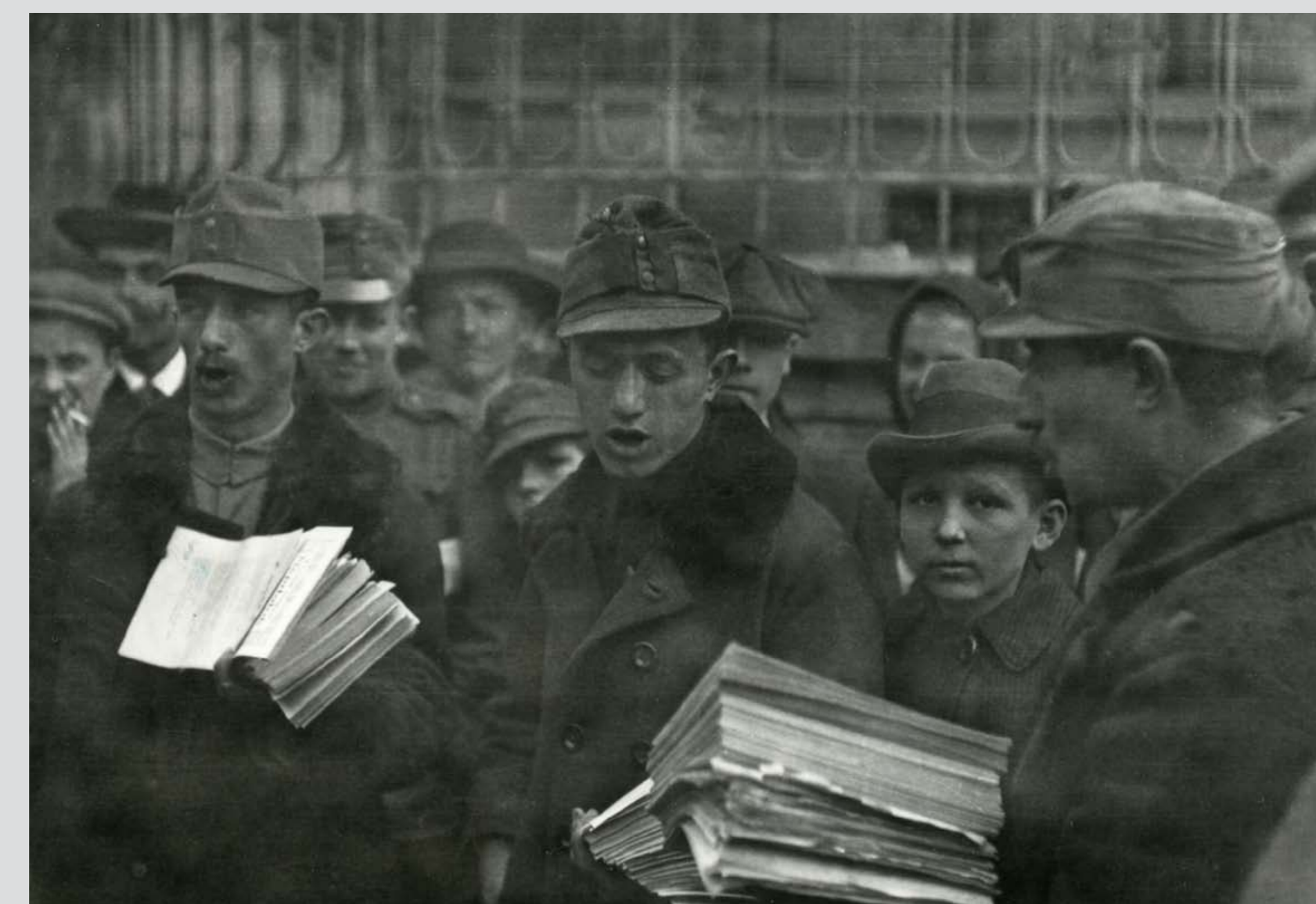
Újságot áruló katonák Budapesten, 1918. november–december Soldiers selling newspapers in Budapest, November–December 1918