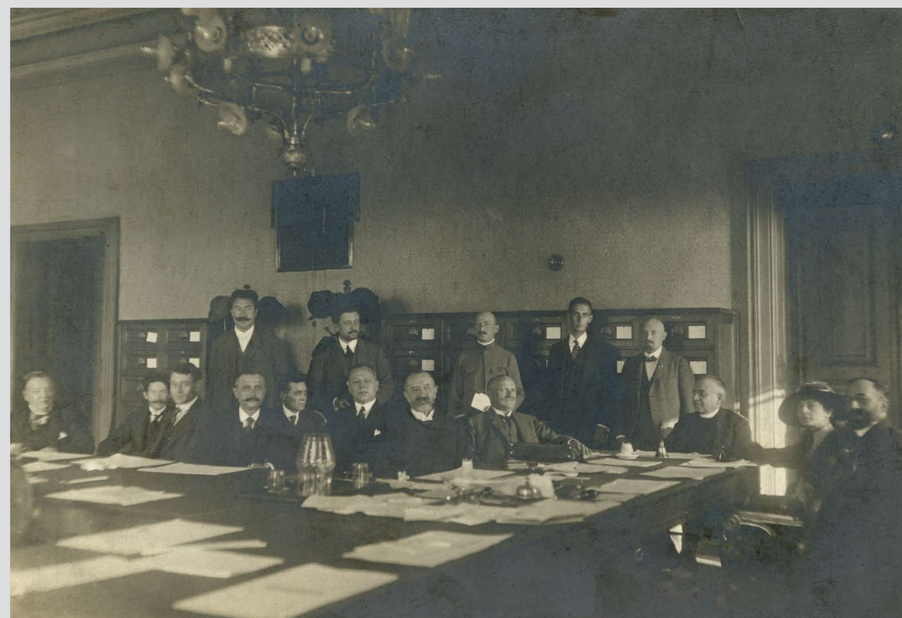
A Nemzeti Tanács ülése, az asztalfőn Hock János elnök. Budapest, 1918. november 20. Session of the National Committee, Chairman János Hock at the head of the table. Budapest, 20 November 1918