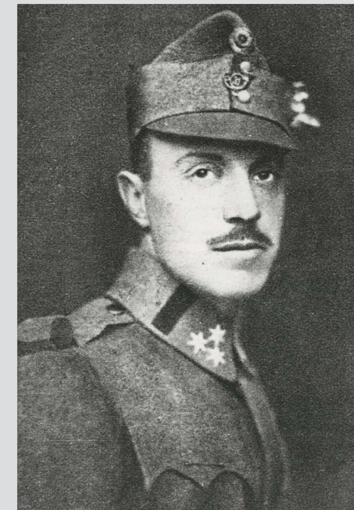
Gróf Festetics Sándor hadügyminiszter, 1918. december 30. – 1919. január 18. Minister of War Count Sándor Festetics, 30 December 1918 – 18 January 1919