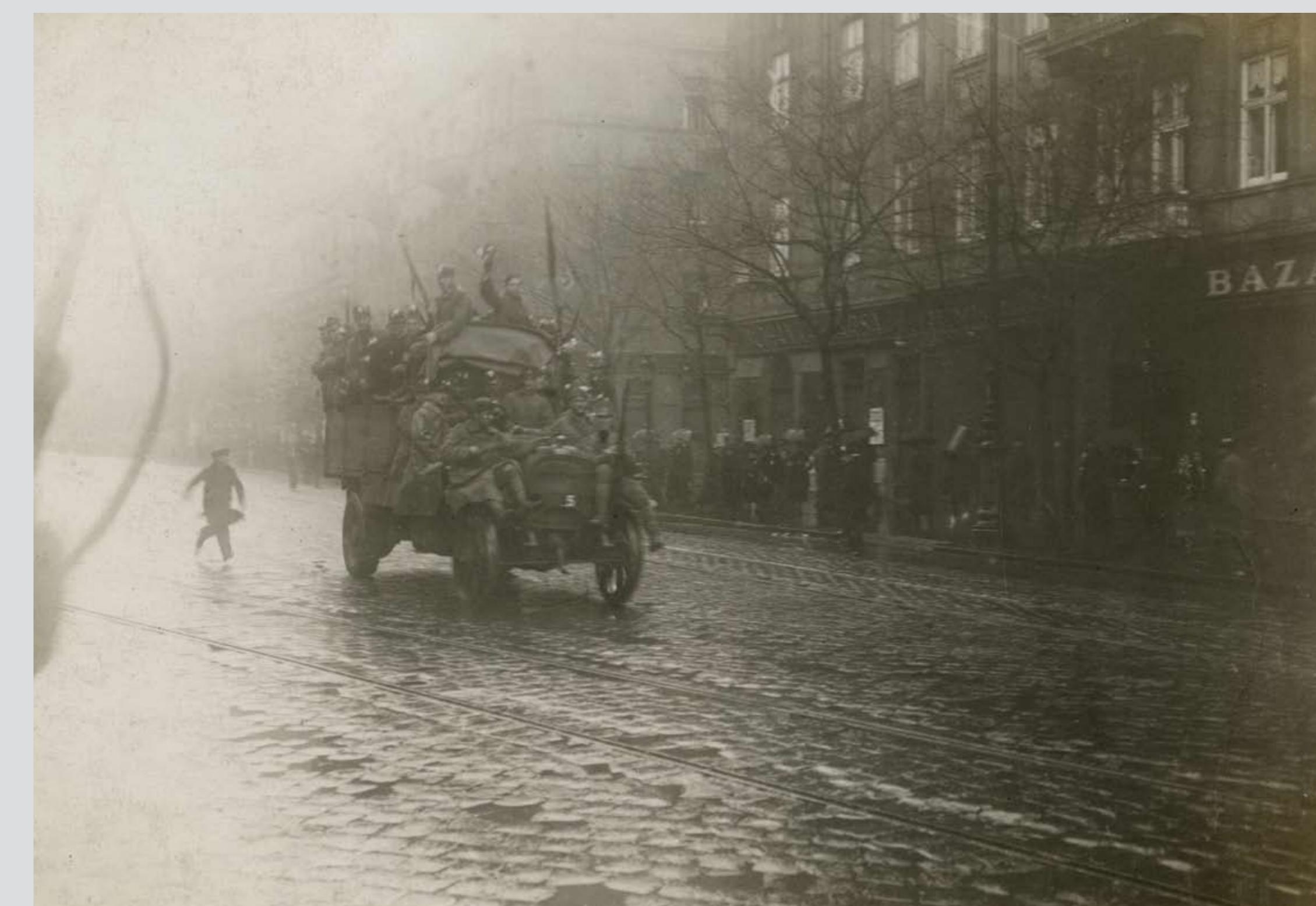
Fegyveres katonák Budapesten, 1918. október 31. Armed soldiers in Budapest, 31 October 1918