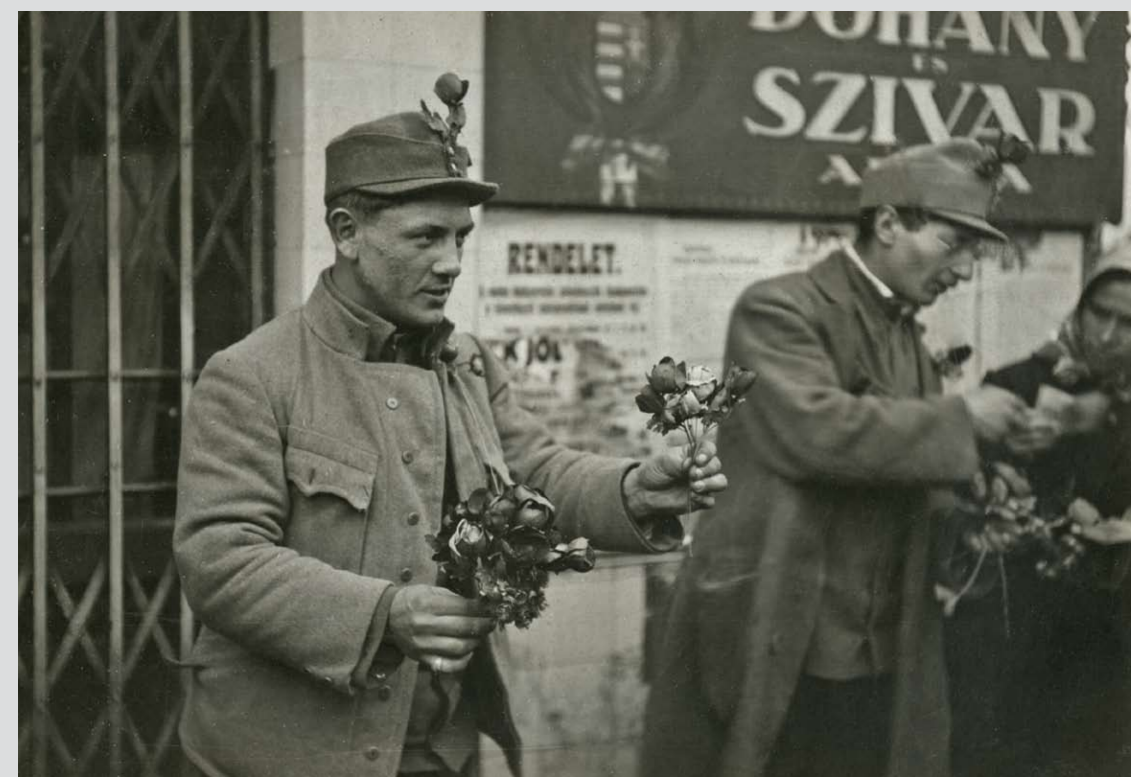
Virágot áruló katonák Budapesten, 1918. november–december Officers selling flowers in Budapest, November–December 1918