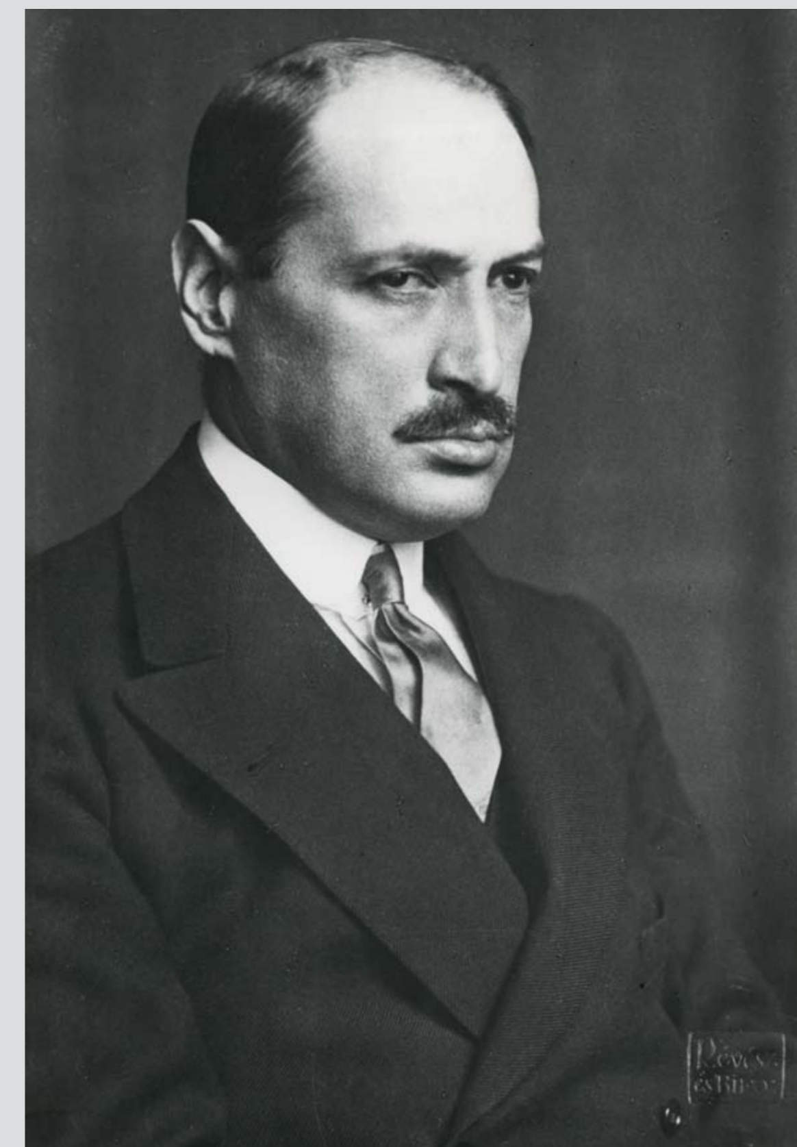
Gróf Károlyi Mihály ideiglenes hadügyminiszter, 1918. december 12–30. Provisional Minister of War Count Mihály Károlyi, 12–30 December 1918

In the autumn of 1918, armed troops primarily with policing functions were newly set up, therefore the country's armed forces were composed of the army (the so-called Hungarian People's Army) along with the National Guards and Civil Militia units.