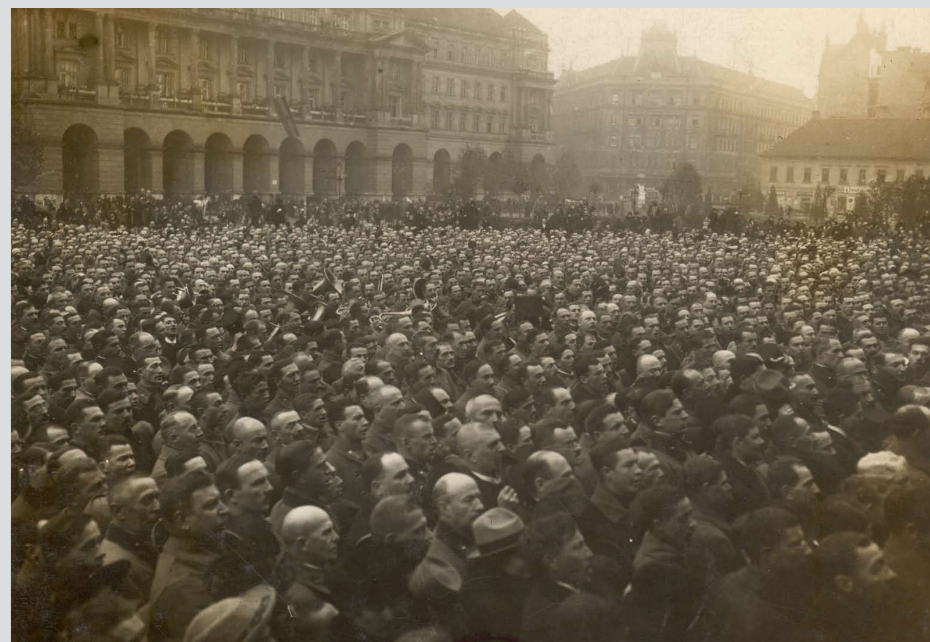
A hadsereg tisztjei leteszik az esküt az Országház téren. Budapest, 1918. november 2. Officers of the new army take their oath at the Parliament Square. Budapest, 2 November 1918