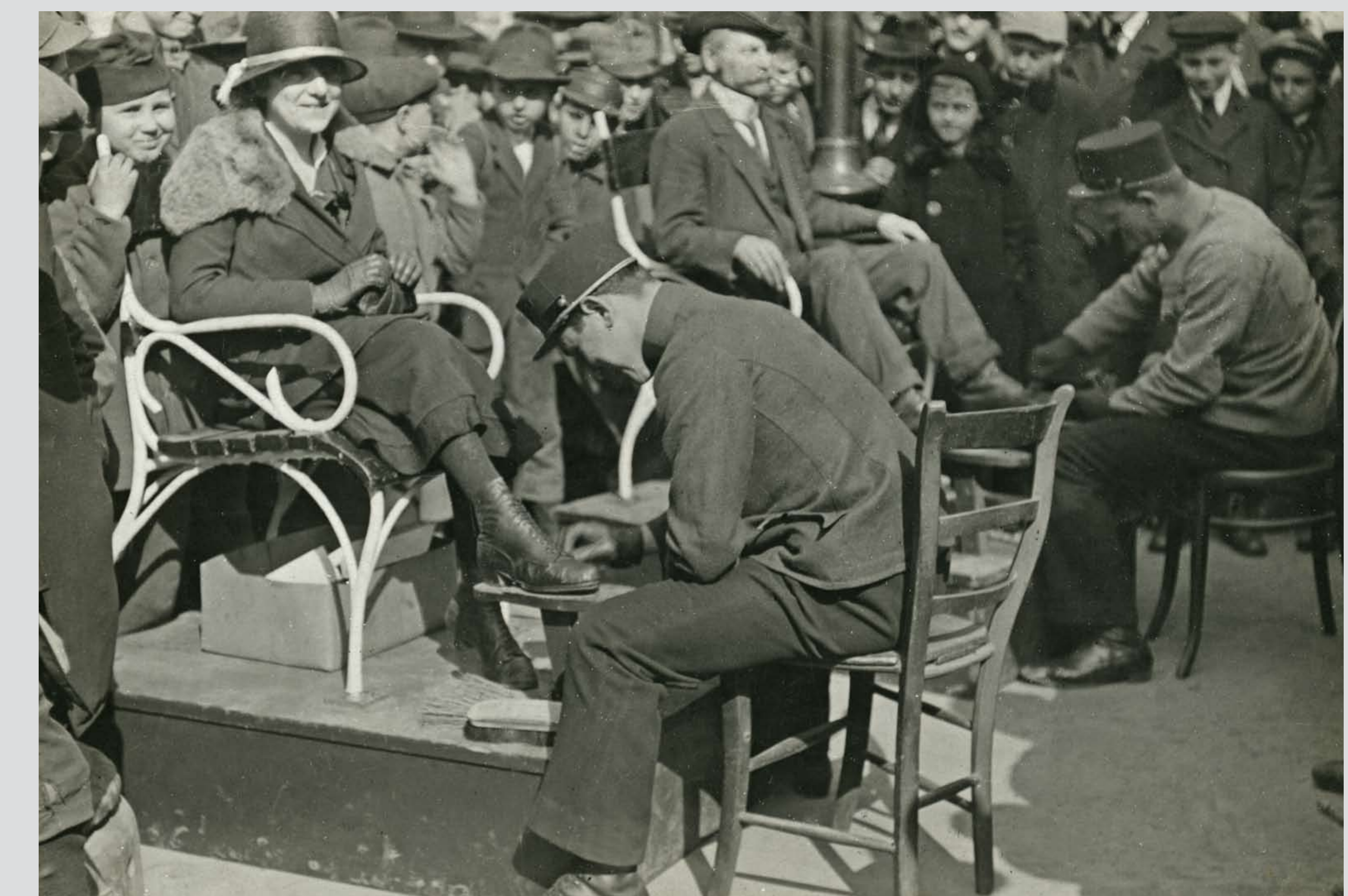
Cipőt tisztító tisztek a Ferenciek terén. Budapest, 1918–1919 Officers as bootblacks in the Square of the Franciscans. Budapest, 1918–1919